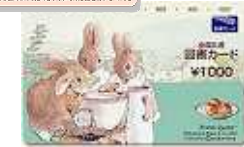
ポイント交換で図書カード